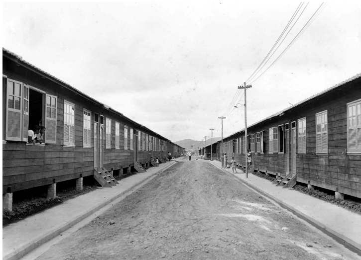
Figura 5 - Acampamento Central no bairro Jardim Paraíba.