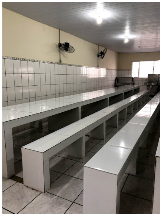
Figura 14 - Refeitório.