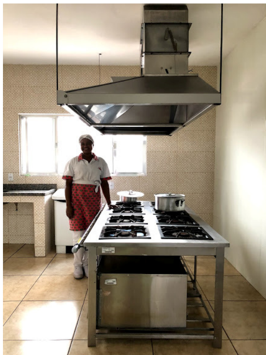
Figura 13 - Cozinha após a reforma.