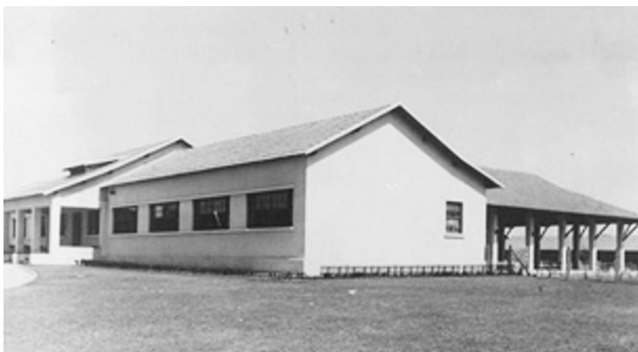
Figura 3 - Foto antiga, assim que o prédio foi construído.

O mesmo telhado de barro, grandes janelas em madeira, um belo pátio no interior, nos leva para a arquitetura dos anos de 1943.