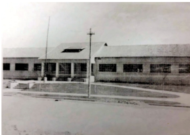
Figura 2 - Vista da fachada, sem reformas década de 1940.

Não existem registros do período da construção pela CSN, apenas relatos e algumas fotos.