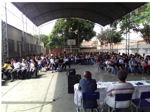
Figura 15 - Quadra Poliesportiva.