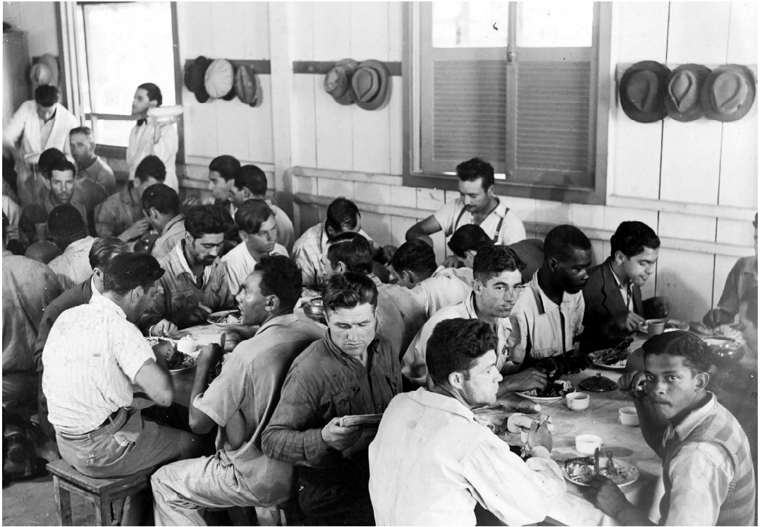
Figura 9 - Horário de almoço dos Arigós no refeitório.