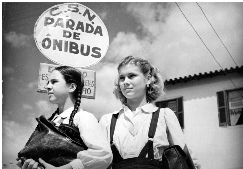
Figura 11 - Meninas indo para a Escola.

Em 1982, com a criação do 2º grau, passou a Colégio Estadual.