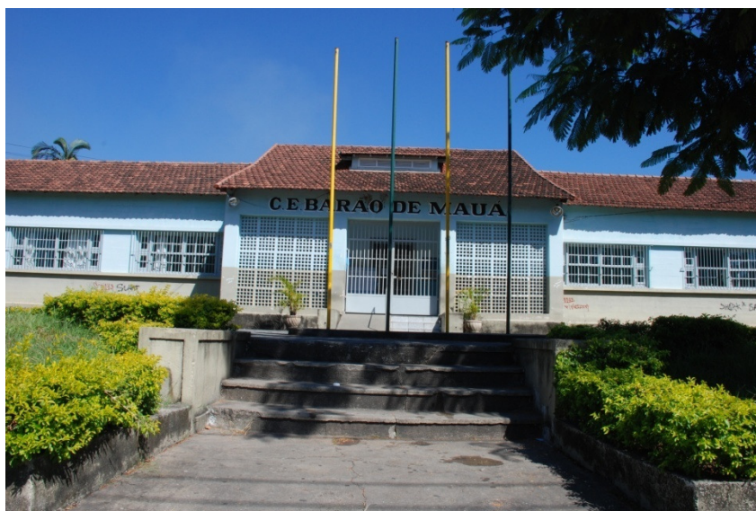
Figura 1 - Fachada Principal.

Modelo simples e funcional, bastante uso de madeiras em portas e esquadrias, telhado de barro (mais utilizado no período), grandes áreas de pátio interno e cômodos amplos e arejados. Estilo que apesar de várias reformas se mantém até os dias de hoje, devido a sua enorme praticidade.