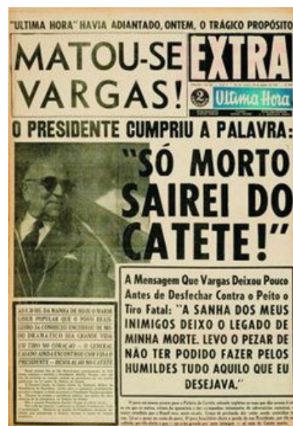
Figura 8 - Getúlio Vargas, manchete de jornal.

Ainda em 1942 a CSN abre o recrutamento de mão - de - obra para a construção da usina de aço. Milhares de homens procediam das lavouras e da pecuária, acostumados à enxada e ao trabalho pesado. Alguns analfabetos e sem qualquer qualificação profissional que os habilitasse para o serviço na indústria, muitos deles são encaminhados ao trabalho braçal nos canteiros de obras. No dia à dia vão conhecendo outras ferramentas e aprendem a manipulá-las, com uma rapidez que surpreende seus mestres de obra. Seu aprendizado, muitas vezes de "fazer, fazendo", inclui o conhecimento do sistema inglês de medidas, em que a unidade mais comum é a polegada, largamente empregada nas especificações de máquinas e equipamentos importados pela CSN.