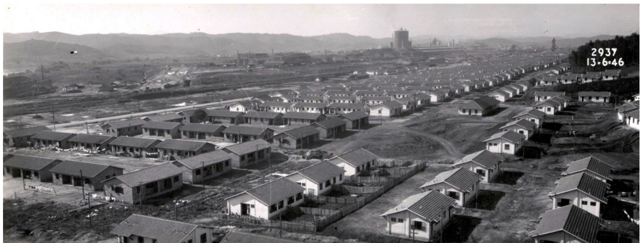
Figura 6 - Construção das casas dos operários.