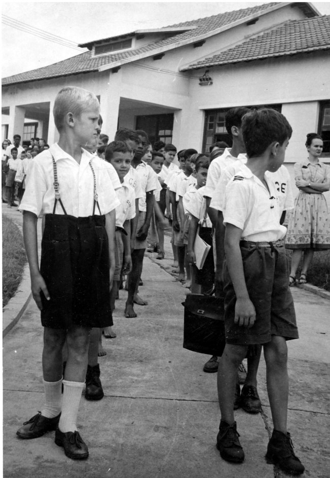
Figura 10 - Os primeiros alunos do Grupo Escolar Barão de Mauá.