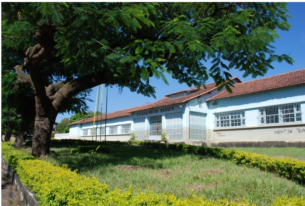
Figura 4 - Fachada com acesso.

O plantio foi alterado. Pelas fotografias de época, podemos observar na construção original, apenas um extenso gramado e caminhos de acesso. Hoje foram plantadas árvores e alguns canteiros de plantas de baixo e médio porte.