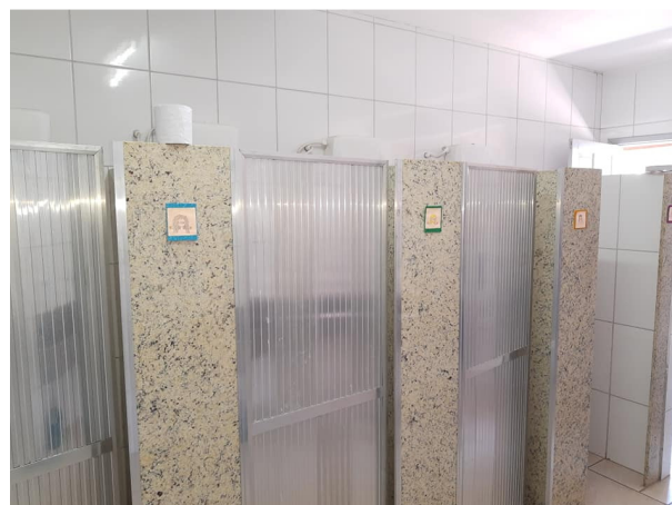
Figura 16 - Sanitário/Vestiário.