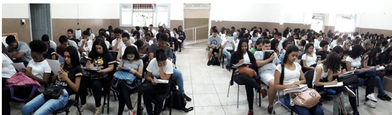
Figura 17 - Atividade de prova do ENEN no Auditório.